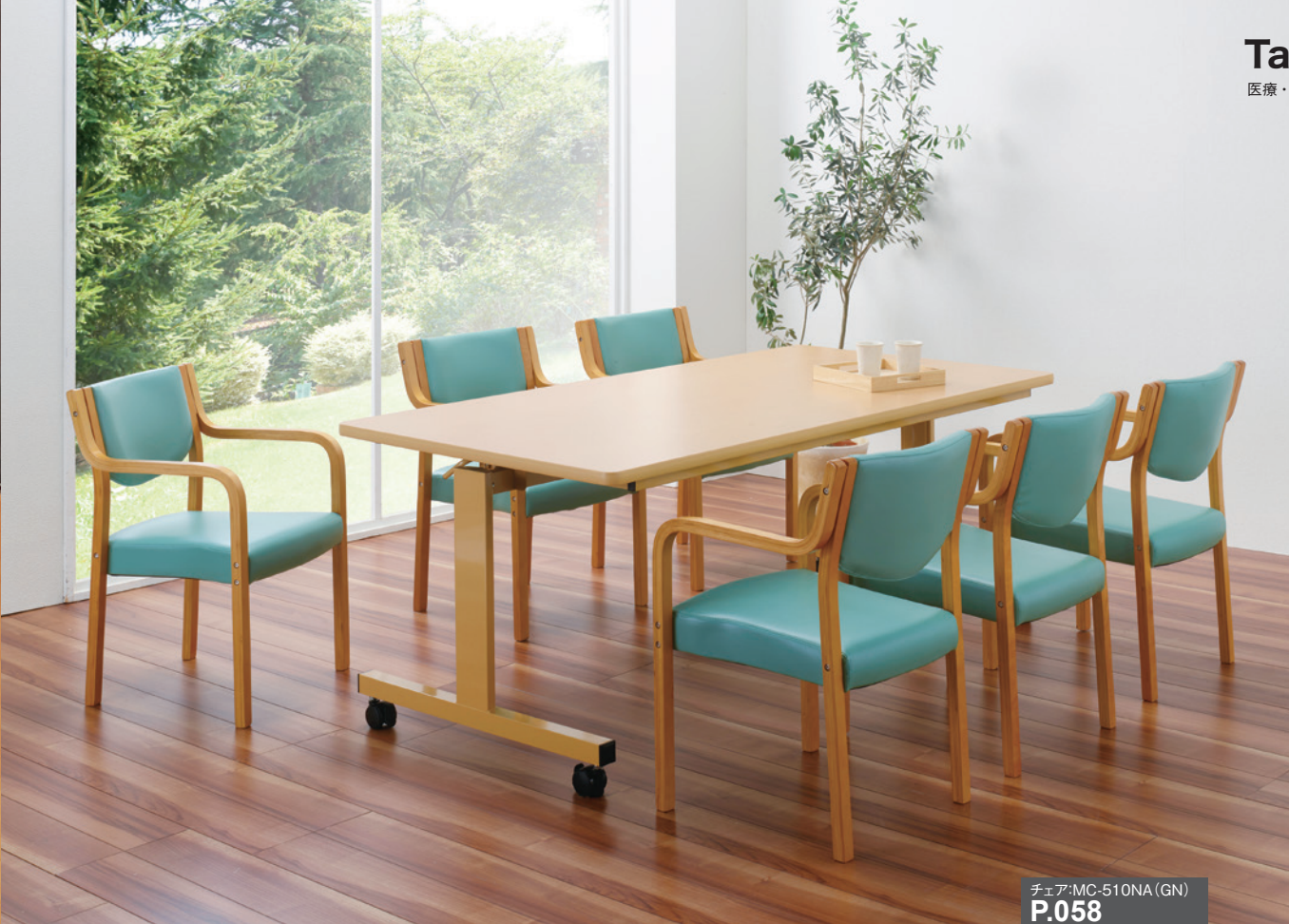
チェア:MC-510NA (GN) P.058