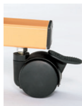
ロック解除時 ロックをすると支柱が降りて、車輪部が深くことでキャスターの動きを止めるリフトロックキャスターを採用。