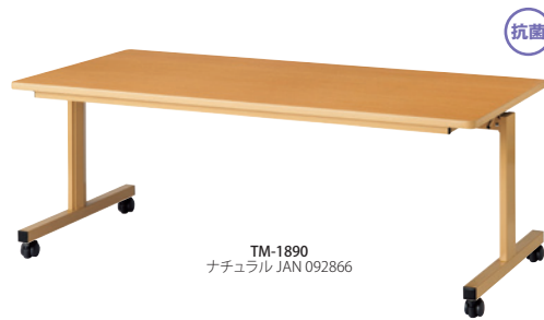
TM-1890 ナチュラル JAN 092866