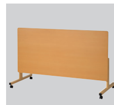
天板下のレバー操作で天板を跳ね上げることができ、収納スペースをとりません。